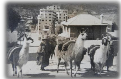
La Paz, Bolivia, 1941

Kontakt mig for at høre mere: armstrong-see@dlgtele.dk Tel. 59 65 90 86