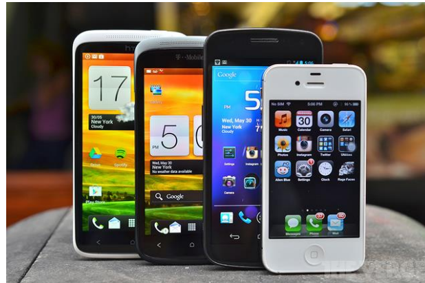
Ældre Sagen, distrikt 5, Smartphones

arrangeret af Kontor Syd i Padborg og Ældre Sagen i Distrikt 5